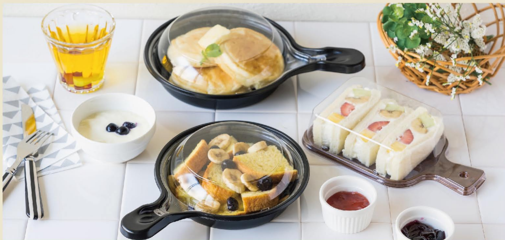
Body with handle